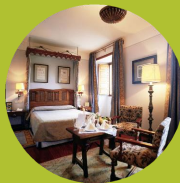
PARADOR DE SANTIAGO