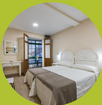
PENSIONES / HOSTALES