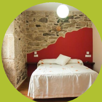
PENSIONES / HOSTALES